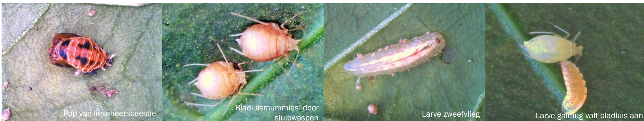
Pop van lieveheersbeestje

Verschillende nuttige insecten eten of parasiteren bladluizen en beperken zo de schade: