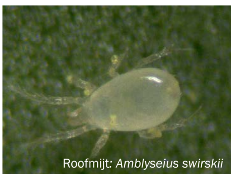
Roofmijt: Amblyseius swirskii

De roofmijt Amblyseius swirskii eet weekhuidmijt op en beperkt zo de schade: