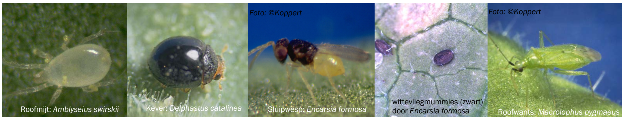
Roofmijt: Amblyseius swirskii

Verschillende nuttige insecten eten of parasiteren witte vlieg en beperken zo de schade: